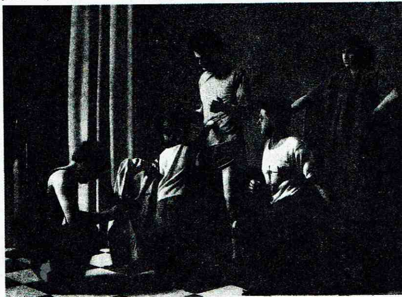
Jonathan Janson, Interno , olieverf op doek, 55 x 65 cm

van schilderijen, die dan te maken hebben met het groepje afgebeelde personen. Een aspect dat direct opvalt is de bijzondere lichtval. Deze komt steeds van links en lijkt de afgebeelde personen gevangen te houden. In enkele schilderijen is dit licht koel en zakelijk te noemen, wat de voorstelling een afstandelijk karakter verleent. Daar tegenover staan dan weer de schilderijen waarin het licht als een zachte waas de scherpe contouren weghaalt en de afgebeelde personen tot droomfiguren maakt. Dit is vooral het geval in portretten van de vrouw met het rode haar. Naast portretten heeft Janson ook een aantal schilderijen gemaakt van autowegen, benzinepompen, kortom van straatbeelden die evenals de portretten door de lichtval een vervreemdende werking hebben. Jonathan Janson werd op 10 november 1950 in South River, New Jersey, USA, geboren en kreeg zijn opleiding aan de kunstacademie van Rhode Island. Hij voelde zich sterk aangetrokken door Europa, belandde in Italië waar hij zich als schilder ontwikkelde en vestigde zich ten slotte in Rome. In zijn werk blijft zijn Amerikaanse achtergrond steeds meespelen en het is misschien wel juist de versmelting van twee cultuurinvloeden die Jansons werk zo aantrekkelijk maakt.