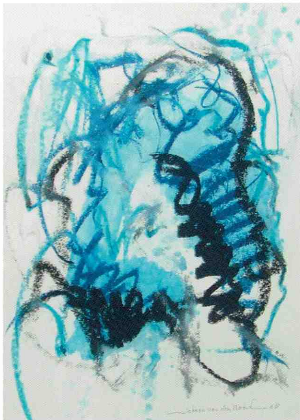
69. 'Isles of Scilly', 2009. Oliekrijt op papier, 59 x 42 cm.